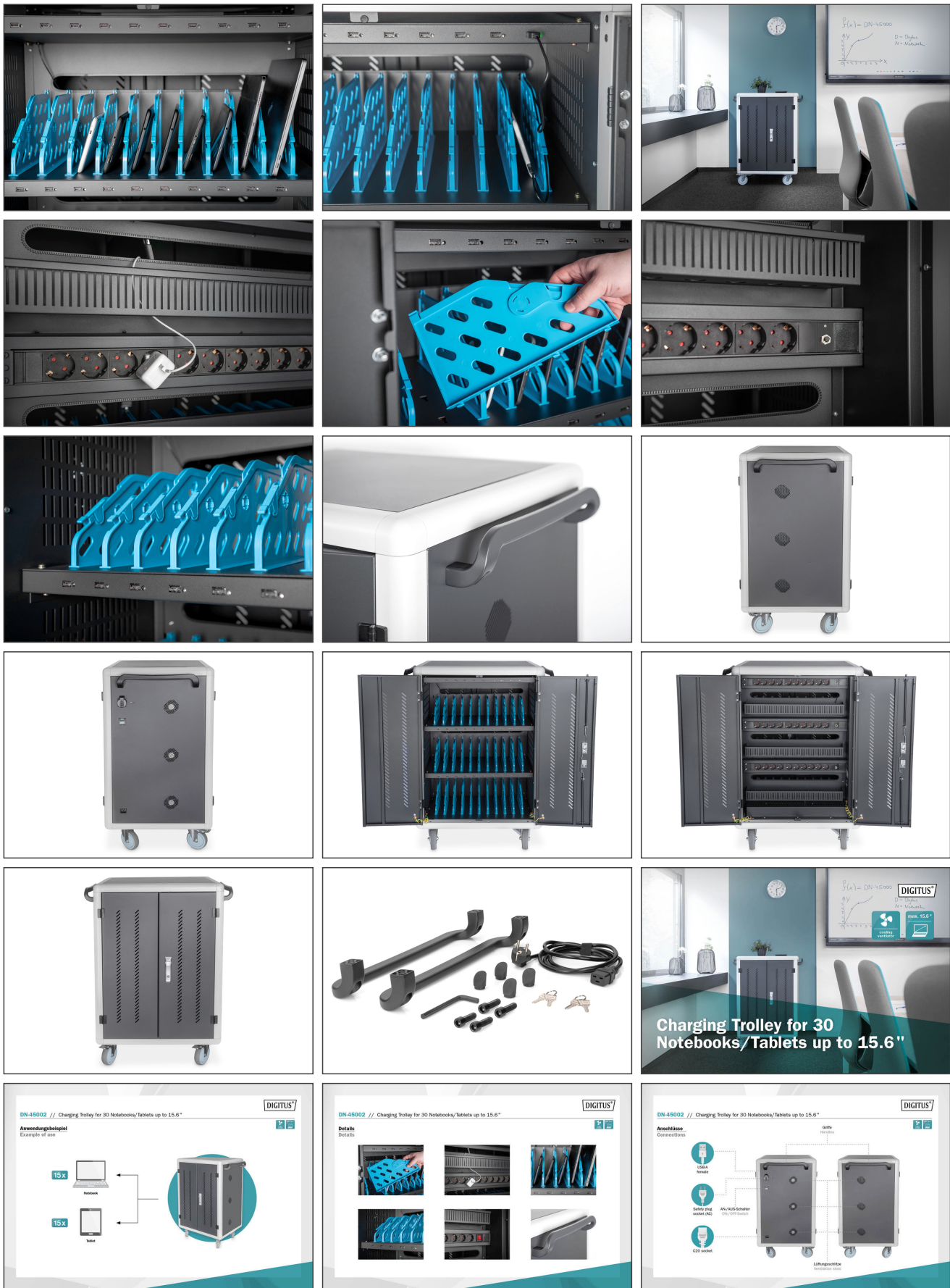
Charging Trolley for 30 Notebooks/Tablets up to 15.6"