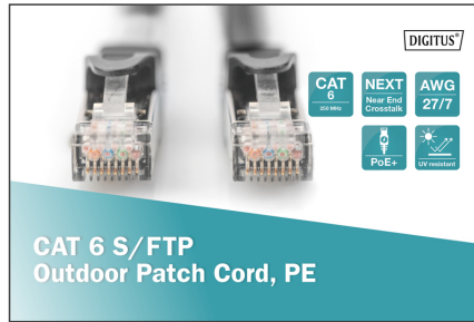
CAT 6 S/FTP Outdoor Patch Cord, PE