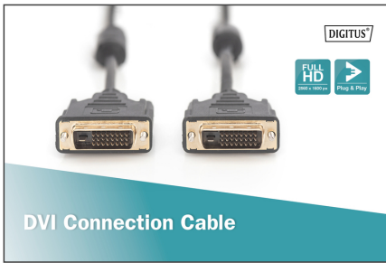
DVI Connection Cable