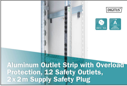
Aluminum Outlet Strip with Overload Protection, 12 Safety Outlets, 2x2m Supply Safety Plug