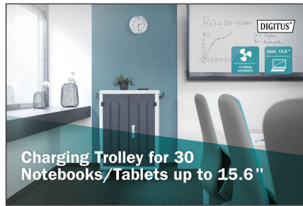
Charging Trolley for 30 Notebooks/ Tablets up to 15.6"