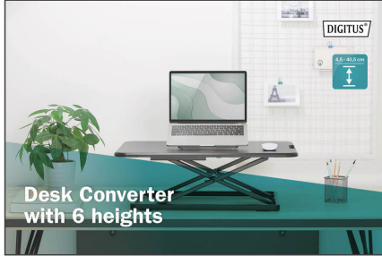
Desk Converter with 6 heights