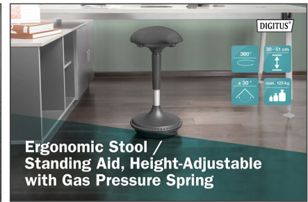
Ergonomic Stool / Standing Aid, Height-Adjustable with Gas Pressure Spring