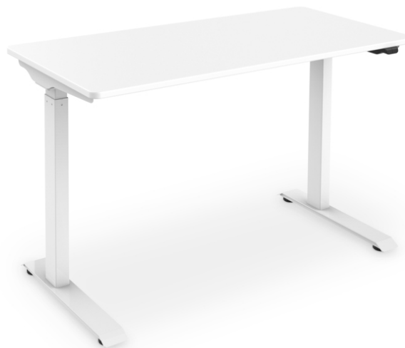
Table électrique à hauteur réglable, plateau 120 x 60 x 18 cm Charge de 50 kg, blanc

Avec ce cadre de table réglable en hauteur de DIGITUS®, vous prenez soin de vous et votre santé ! La table peut être facilement réglée en hauteur de 73 à 123 cm grâce au panneau de commande intégré. L'installation est relativement simple grâce aux éléments de table pré-assemblés. La table supporte une charge maximale de 50 kg. Elle est conçue pour les écrans, les ordinateurs portables et le matériel de travail courant. La conception du support en forme de C vous offre un maximum d'espace pour les jambes. Prenez soin de votre santé et prévenez les défauts de posture et limitations de l'appareil locomoteur en changeant régulièrement de position de travail !