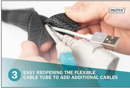
3 EASY REOPENING THE FLEXIBLE CABLE TUBE TO ADD ADDITIONAL CABLES