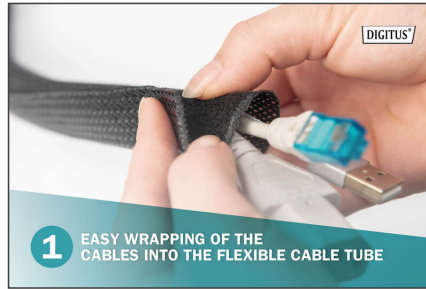
1 EASY WRAPPING OF THE CABLES INTO THE FLEXIBLE CABLE TUBE