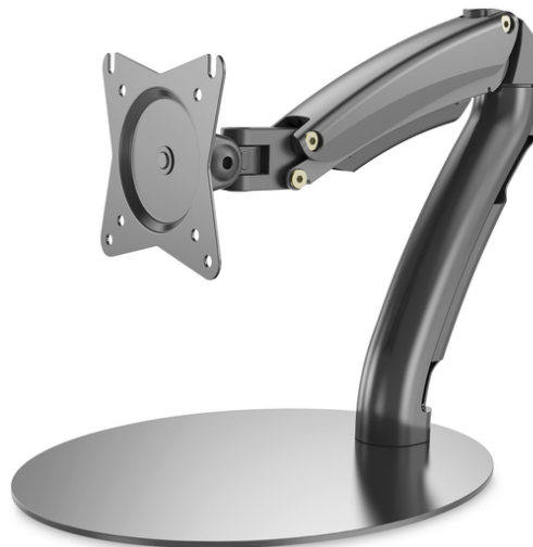
Table stand for LCD/LED monitor up to 27" flexible gas spring mount, max 6,5kg, VESA 100x100

Универсальная стойка для установки светодиодных и ЖК-мониторов всех марок размером до 69 см (27"). Благодаря рычагу с газово-пружинным механизмом можно зафиксировать любую высоту расположения монитора. При выборе подходящего крепления для монитора следует учитывать лишь размер VESA, а также вес Вашего монитора.