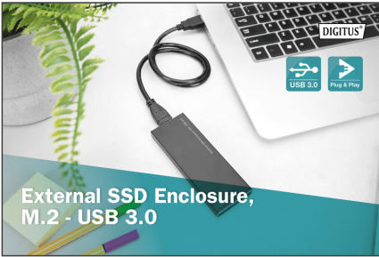
External SSD Enclosure, M.2 - USB 3.0