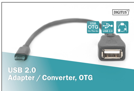
USB 2.0 Adapter / Converter, OTG