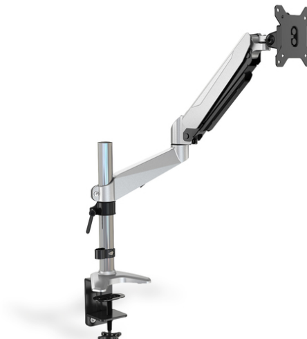
Table mount for LCD/LED monitor up to 27" flexible gas spring mount, 8kg max, VESA 100x100

Con el soporte de escritorio para monitor, puede acoplar fácilmente un monitor de 15 a 32" a su escritorio con una abrazadera de fijación. Con poco esfuerzo, puede mover los monitores según sus necesidades y orientarlos, inclinarlos o girarlos para, por ejemplo, colocarlos en formato vertical. El soporte del resorte de gas integrado le facilita el ajuste de la altura de sus monitores. Haga algo bueno por usted mismo y su salud, adaptando de manera óptima el monitor a su cuerpo y a su postura cuando está sentado. Además, los cables de los monitores se pueden trasladar cuidadosamente a través de las guías de cable suministradas.