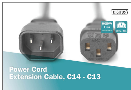
Power Cord Extension Cable, C14 - C13