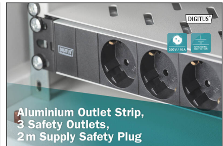
Aluminium Outlet Strip, 3 Safety Outlets, 2m Supply Safety Plug