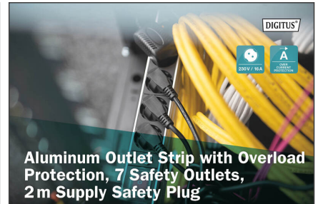
Aluminum Outlet Strip with Overload Protection, 7 Safety Outlets, 2m Supply Safety Plug