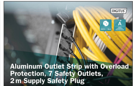
Aluminum Outlet Strip with Overload Protection, 7 Safety Outlets, 2m Supply Safety Plug