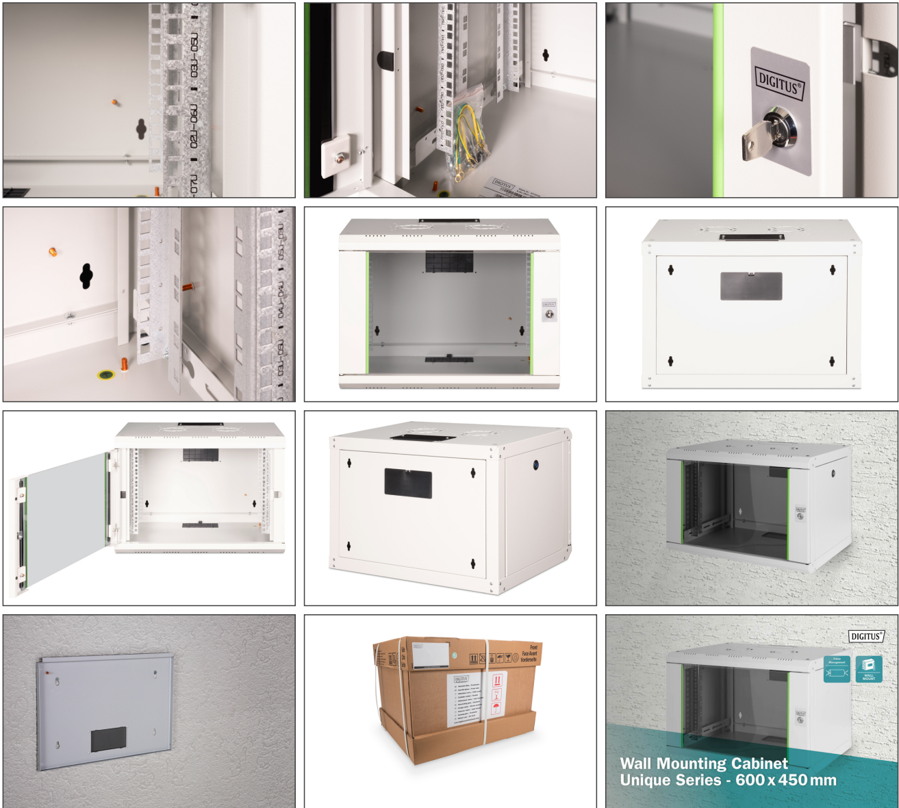
Wall Mounting Cabinet Unique Series - 600x450 mm